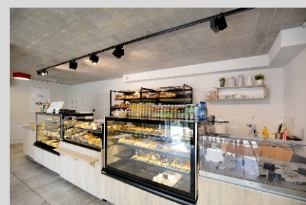
Piekarnia SOBOWIDZ SOBOWIDZ bakery

Luminous flux and power tolerance +/- 10% The manufacturer reserves the right to change the design of the luminaire. It is possible to modify the product at the customer's request. The information contained in the catalog card does not constitute a commercial offer or an element of the contract. More information about the product family can be found at: www.lako.pl