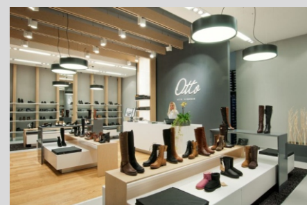
Sklep OTTO SCHUMAN OTTO SCHUMAN shop