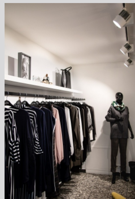
Butik POSH LADY POSH LADY butique

Luminous flux and power tolerance +/- 10% The manufacturer reserves the right to change the design of the luminaire. It is possible to modify the product at the customer's request. The information contained in the catalog card does not constitute a commercial offer or an element of the contract. More information about the product family can be found at: www.lako.pl