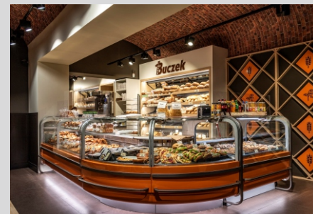
Piekarnia JAN BUCZEK JAN BUCZEK bakery