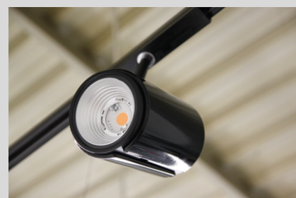
Projekt LAKO LAKO project