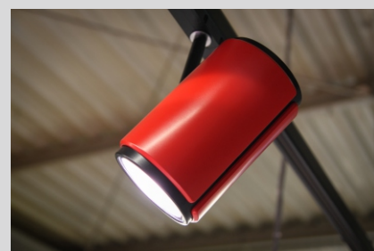
Projekt LAKO LAKO project