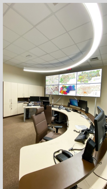
Biuro MPK, Kraków MPK office, Cracow