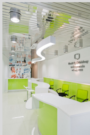
Bank Spółdzielczy, Adamów 'Spółdzielczy' Bank, Adamów