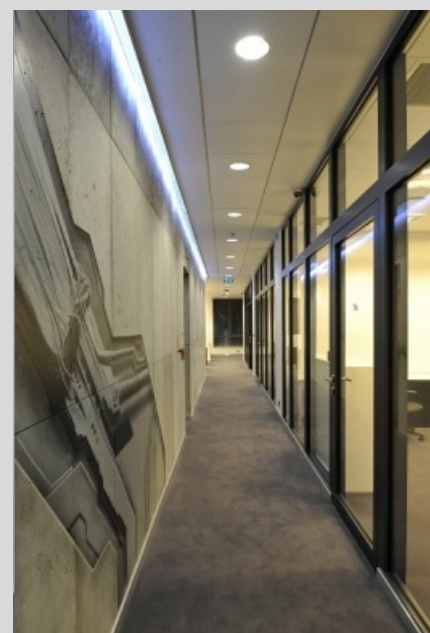
Biurowiec ESET, Kraków ESET office, Cracow

Tolerancja strumienia świetlnego i mocy +/- 10% Producent zastrzega sobie możliwość zmian konstrukcyjnych oprawy. Istnieje możliwość modyfikacji produktu na życzenie Klienta. Informacje zawarte na karcie katalogowej nie stanowią oferty handlowej ani elementu umowy. Więcej na temat rodziny produktów, znajduje się na stronie: www.lako.pl