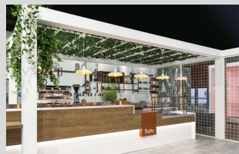
Targi HOST, Mediolan HOST fair trade, Milan

Tolerancja strumienia świetlnego i mocy +/- 10% Producent zastrzega sobie możliwość zmian konstrukcyjnych oprawy. Istnieje możliwość modyfikacji produktu na życzenie Klienta. Informacje zawarte na karcie katalogowej nie stanowią oferty handlowej ani elementu umowy. Więcej na temat rodziny produktów, znajduje się na stronie: www.lako.pl