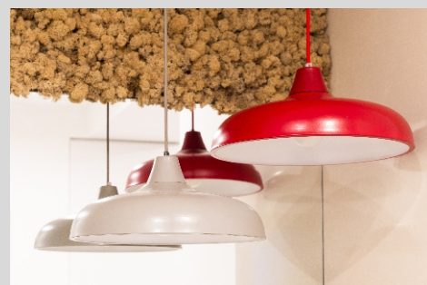
Apartament prywatny, Bielsko-Biała Private apartment, Bielsko-Biała