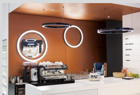
Targi EUROSHOP, Niemcy EUROSHOP fair trade, Germany

Tolerancja strumienia świetlnego i mocy +/- 10% Producent zastrzega sobie możliwość zmian konstrukcyjnych oprawy. Istnieje możliwość modyfikacji produktu na życzenie Klienta. Informacje zawarte na karcie katalogowej nie stanowią oferty handlowej ani elementu umowy. Więcej na temat rodziny produktów, znajduje się na stronie: www.lako.pl