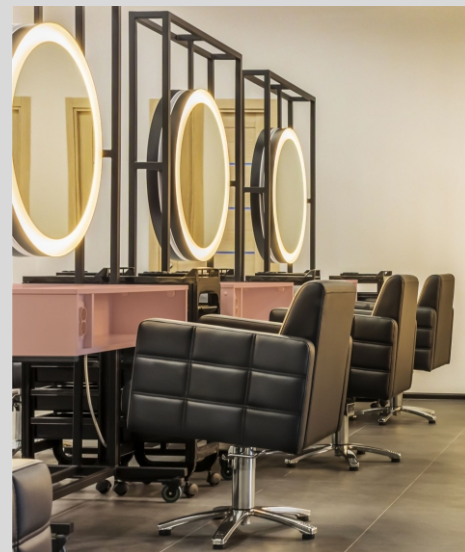
Koncept LAKO LAKO concept

Obudowa w dowolnym kolorze RAL Housing in any RAL colour