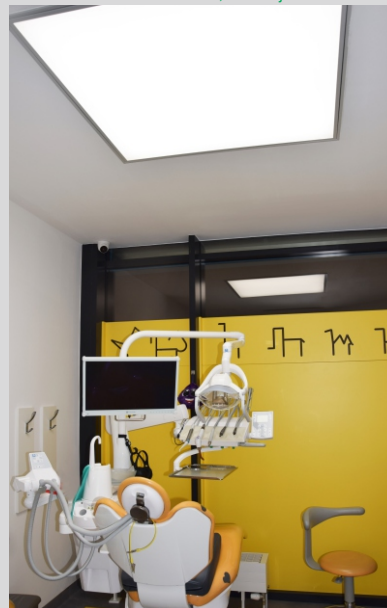
Klinika stomatologiczna, RENTOLANDIA, Warszawa RENTOLANDIA dental clinic, Warsaw