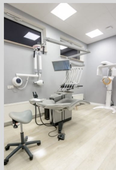
Klinika stomatologiczna, SMILE SERVICE, Świnoujście SMILE SERVICE dental clinic, Świnoujście