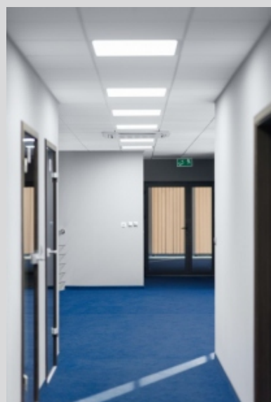
Biuro ANTRANS, Sławków ANTRANS office, Sławków

Tolerancja strumienia świetlnego i mocy +/- 10% Producent zastrzega sobie możliwość zmian konstrukcyjnych oprawy. Istnieje możliwość modyfikacji produktu na życzenie Klienta. Informacje zawarte na karcie katalogowej nie stanowią oferty handlowej ani elementu umowy. Więcej na temat rodziny produktów, znajduje się na stronie: www.lako.pl