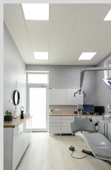
Klinika stomatologiczna, SMILE SERVICE, Świnoujście SMILE SERVICE dental clinic, Świnoujście