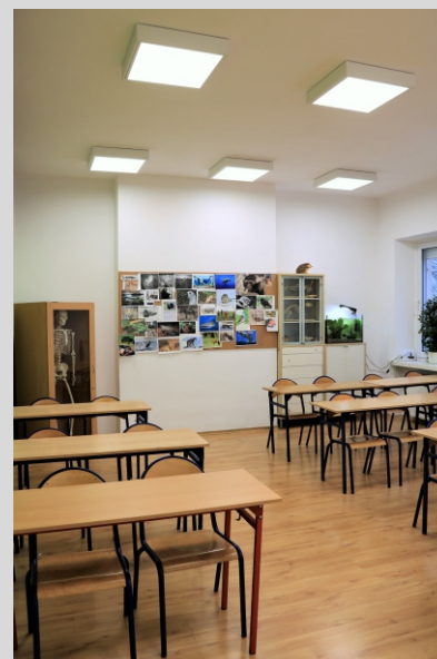
Liceum ogólnokształcące nr 2 im. Pawła Jasionicy, Warszawa High school, Warsaw