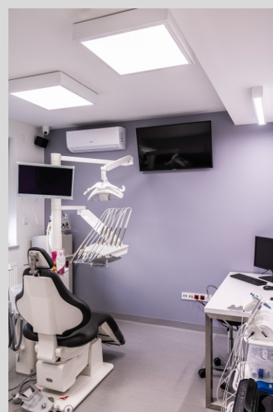
Klinika stomatologiczna DENTRUM, Katowice DENTRUM dental clinic, Katowice