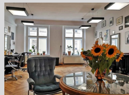
Salon fryzjerski HAIR ME UP, Kraków HAIR ME UP hairdresser's salon, Cracow

Tolerancja strumienia świetlnego i mocy +/- 10% Producent zastrzega sobie możliwość zmian konstrukcyjnych oprawy. Istnieje możliwość modyfikacji produktu na życzenie Klienta. Informacje zawarte na karcie katalogowej nie stanowią oferty handlowej ani elementu umowy. Więcej na temat rodziny produktów, znajduje się na stronie: www.lako.pl