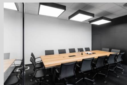
Biuro ALL IN GAMES, Kraków ALL IN GAMES office, Cracow