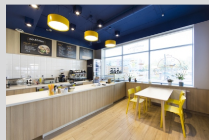
Piekarnia FAMILY FRIENDS, Wrocław FAMILY FRIENDS bakery, Wrocław