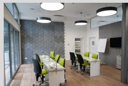
Salon V&K COSMETIC, Bielsko-Biała V&K COSMETIC beauty salon, Bielsko-Biała