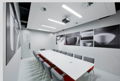
Siedziba główna MARMITE, Zakrzewo MARMITE headquarters, Zakrzewo