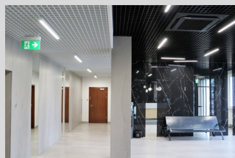
Siedziba SOLID SECURITY, Warszawa SOLID SECURITY headquarters, Warsaw