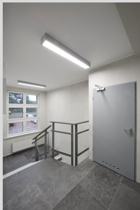
Siedziba PWiK, Rybnik PWiK headquarters, Rybnik