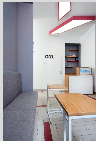
32 Nowa Stomatologia, Kraków 32 Nowa Stomatologia dental clinic, Cracow