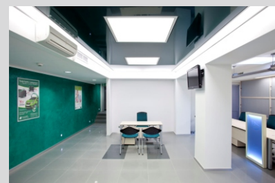
BANK SPÓŁDZIELCZY, Skawina SPOLDZIELCZY BANK, Skawina

Tolerancja strumienia świetlnego i mocy +/- 10% Producent zastrzega sobie możliwość zmian konstrukcyjnych oprawy. Istnieje możliwość modyfikacji produktu na życzenie Klienta. Informacje zawarte na karcie katalogowej nie stanowią oferty handlowej ani elementu umowy. Więcej na temat rodziny produktów, znajduje się na stronie: www.lako.pl