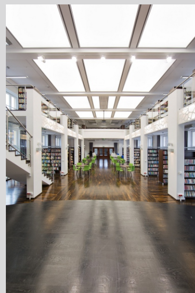
Biblioteka, Wisła Library, Wisła