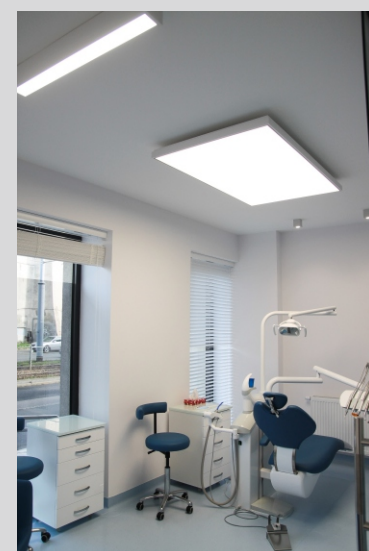
Gabinet stomatologiczny MERITUM, Łódź MERITUM dental office, Łódź

Tolerancja strumienia świetlnego i mocy +/- 10% Producent zastrzega sobie możliwość zmian konstrukcyjnych oprawy. Istnieje możliwość modyfikacji produktu na życzenie Klienta. Informacje zawarte na karcie katalogowej nie stanowią oferty handlowej ani elementu umowy. Więcej na temat rodziny produktów, znajduje się na stronie: www.lako.pl