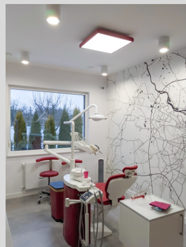
Stomatologia Jakub Jędrzysek, Rawicz Jakub Jędrzysek dental clinic, Rawicz