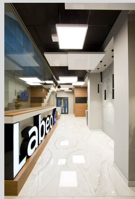
Biurowiec LABEO, Kraków LABEO office, Cracow

Tolerancja strumienia świetlnego i mocy +/- 10% Producent zastrzega sobie możliwość zmian konstrukcyjnych oprawy. Istnieje możliwość modyfikacji produktu na życzenie Klienta. Informacje zawarte na karcie katalogowej nie stanowią oferty handlowej ani elementu umowy. Więcej na temat rodziny produktów, znajduje się na stronie: www.lako.pl