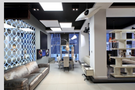
Salon ART CINEMA, Warszawa ART CINEMA store, Warsaw