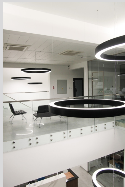
Siedziba DETAL-MET, Wrocław DETAL-MET headquarters, Wrocław