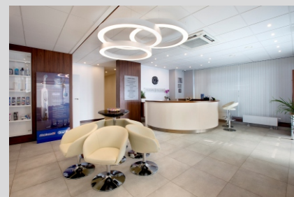
Klinika stomatologiczna, Nowolipie Dental clinic, Nowolipie

The pieces of information contained in the catalogue card constitute neither a commercial offer nor an element of the contract. More information about the product family may be found on the website: www.lako.pl