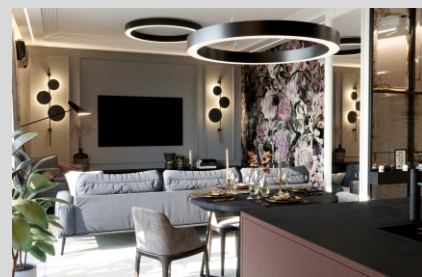
Prywatny apartament, Wrocław Private apartment, Wrocław