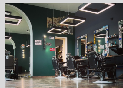
Barbershop, Lublin Barbershop, Lublin

Tolerancja strumienia świetlnego i mocy +/- 10% Producent zastrzega sobie możliwość zmian konstrukcyjnych oprawy. Istnieje możliwość modyfikacji produktu na życzenie Klienta. Informacje zawarte na karcie katalogowej nie stanowią oferty handlowej ani elementu umowy. Więcej na temat rodziny produktów, znajduje się na stronie: www.lako.pl